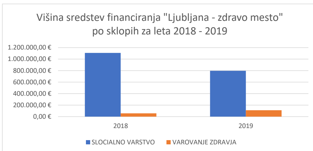
Graf 3: Primerjava višine sredstev sofinanciranja iz razpisa Ljubljana – zdravo mesto

Naslednji graf pa predstavlja višino sofinanciranja celotnega programa socialnega varstva iz strani MOL, za leto 2018 in 2019. Skupno je MOL na tem razpisu v letu 2018 namenila 1.165.100,00€, v letu 2019 pa 908.400,00€.